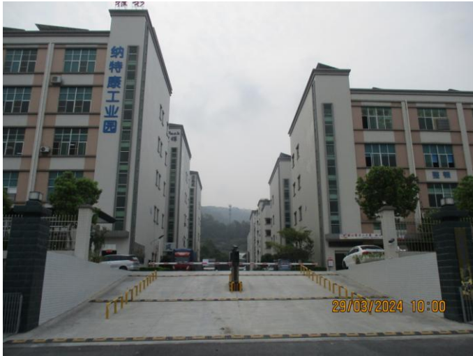
Industrial park entrance