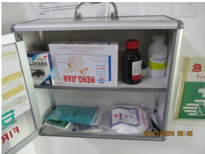
First aid kit