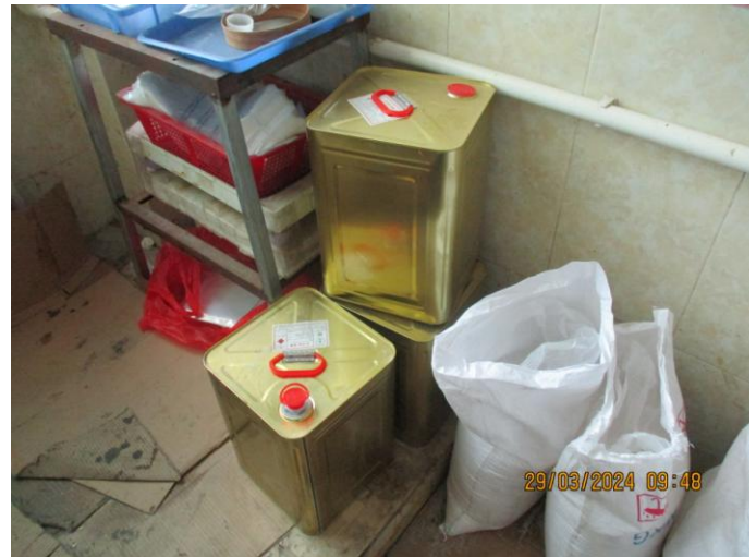
NC-Chemicals not stored in secondary containment