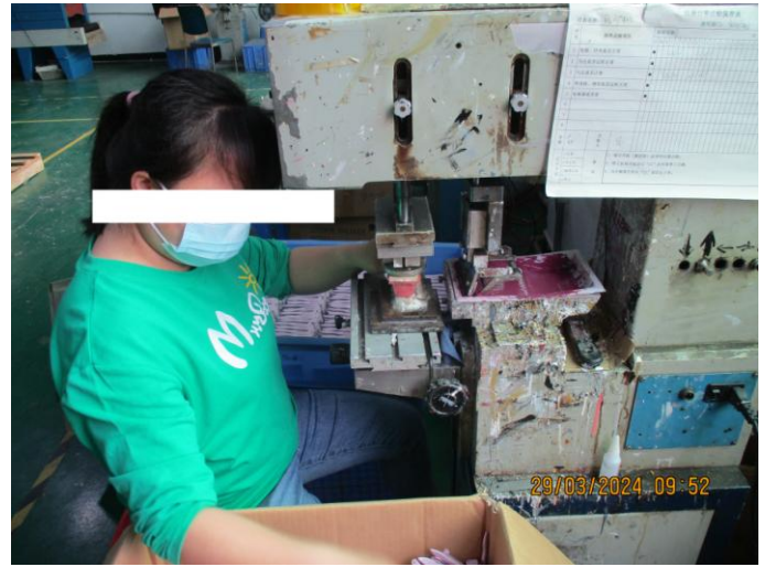
NC-Improper mask for silk-printing worker