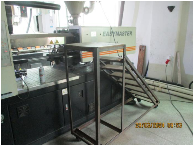
NC-Missing handrails for ladder