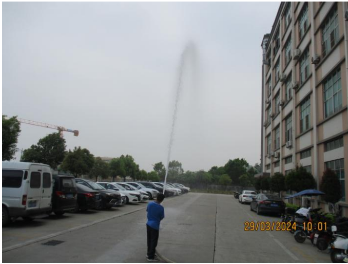
Fire hydrant test