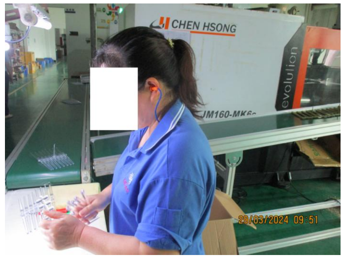
Worker wearing earplugs